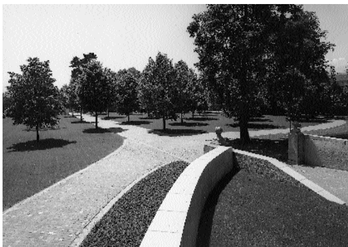
Le portail percé par Jean-Georges Guiguer dans le mur de soutènement de l'avenue. Il donne accès aux terre-pleins et au quinconce de tilleuls gagnés dès 1756 sur le fossé bordant le château au sud. Etat après restauration.

Une perspective est en train de naître: Jean-Georges la prolongera au-delà des terre-pleins jusque dans la campagne avoisinante, comme en témoigne l'actuelle route publique du Clos qui en reprend le tracé. Le terre-plein haut est ensuite planté d'un quinconce de tilleuls formant une salle verte de grande dimension, destinée à la promenade. Enfin, l'un des termes de la convention avec la Communauté de Prangins prévoyant la participation du baron à la reconstruction du nouveau temple paroissial face à la cour du château, Jean-Georges profite de l'occasion pour donner à l'allée principale du potager une