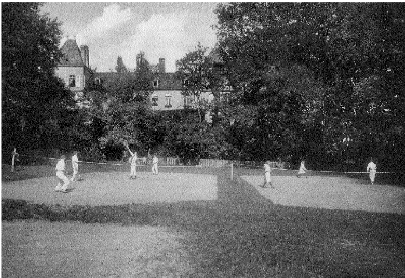
Les terrains de sport installés par les Frères moraves sur les terre-pleins de Jean-Georges Guiguer dès 1873. Ici les courts de tennis vers 1913.

qui entoure le château comprend quatre hectares et demi environ, aire réduite mais qui regroupe heureusement la plupart des pièces originales des jardins : les cours et les terrasses du château, mais aussi le quinconce de la salle verte, et surtout le grand jardin potager, restitué dans ses forme et fonction premières à l'occasion des travaux récents de restauration. On y cultive aujourd'hui des variétés maraîchères anciennes et locales, patiemment rassemblées à l'issue d'une étude pluridisciplinaire de longue haleine au cours de laquelle les impératifs de la recherche historique ont coïncidé avec les préoccupations de la conservation des ressources végétales : par ses collections de légumes oubliés, de fruitiers rares, le potager participe désormais à la sauvegarde d'un patrimoine